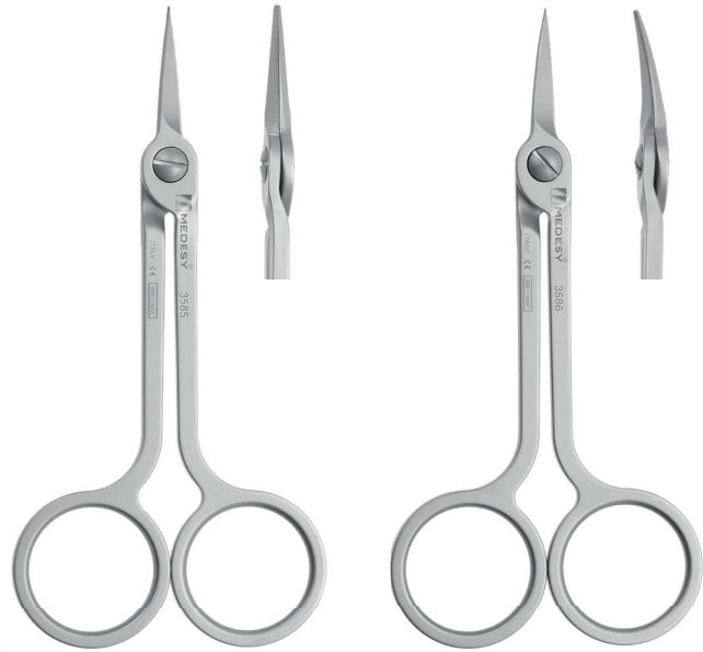
3585 (mm 115) Medesy Hi-Tech Straight Retta