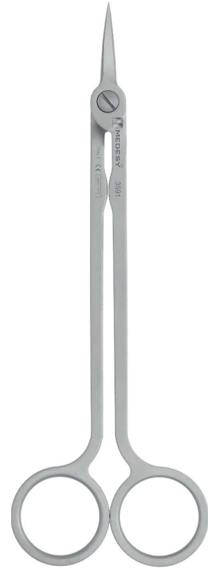
3591 (mm 160) Medesy Hi-Tech Curved Curva