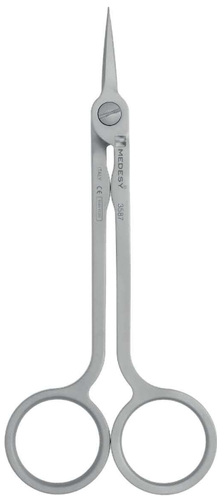
3587 (mm 130) Medesy Hi-Tech Straight Retta