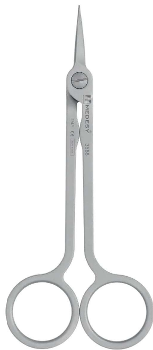
3588 (mm 130) Medesy Hi-Tech Curved Curva